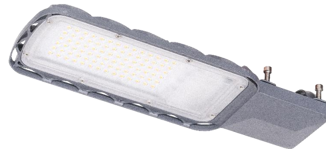
Светильник светодиодный URBAN LITE